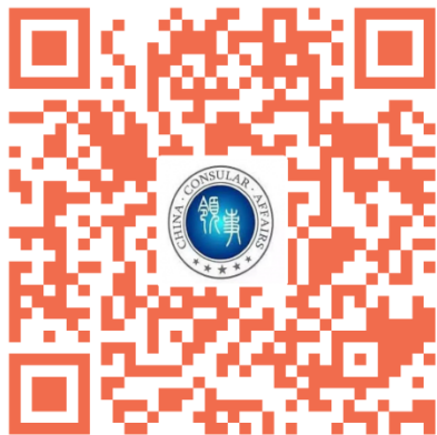
駐澳使領館 領事服務