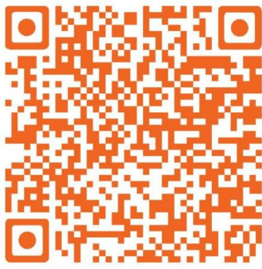
駐澳使領館 領保應急電話